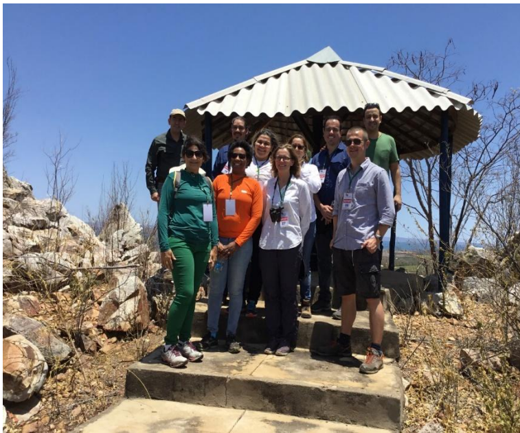
Vale do São Francisco/ Sobradinho-BA / Fazenda Labrunier I. Mirante localizado na área de preservação permanente da fazenda Labrunier I (Produção de Uvas de Mesa para exportação).

A formação da Rede Sufica, com algumas universidades, se deu nesse contexto de aprendizado e crescimento. O nome da rede deriva da designação original em inglês, " Sustainable fruit farming in the Caatinga: managing ecosystem service tradeoffs at the food-water-environment nexus as agriculture intensifies (SUFFICA) ", posteriormente designada em língua portuguesa "Cultivo sustentável de fruteiras na Caatinga: manejo dos serviços ecossistêmicos em agricultura intensiva (SUFICA)". A pesquisa com polinização se desenvolveu na área de fruticultura irrigada do Vale do São Francisco, que abrange territórios da Bahia e de Pernambuco, e é área de atuação de algumas das instituições nacionais parceiras no projeto.