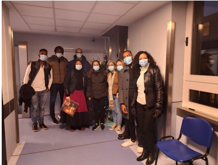
Missão Pesquisa Portugal