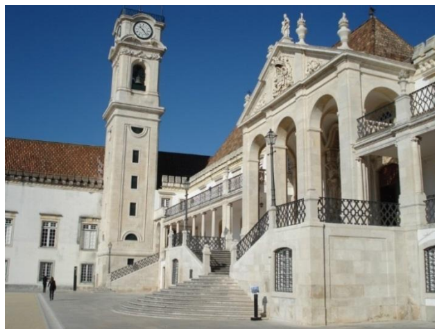
Paço das Escolas: Torre e Via Latina, Universidade de Coimbra

Dentre as instituições portuguesas de ensino que desenvolvem ou já desenvolveram alguma ação de cooperação com a Universidade do Estado da Bahia (UNEB), a Universidade de Coimbra (UC) se destaca porque já foram realizadas várias ações conjuntas, a exemplo do intercâmbio de discentes, docentes e pesquisadores, participação em seminários e encontros acadêmicos, atividades conjuntas de pesquisa e outras similares.