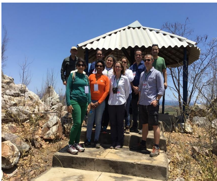
Vale do São Francisco/ Sobradinho-BA / Fazenda Labrunier I. Mirante localizado na área de preservação permanente da fazenda Labrunier I (Produção de Uvas de Mesa para exportação).

A formação da Rede Sufica, com algumas universidades, se deu nesse contexto de aprendizado e crescimento. O nome da rede deriva da designação original em inglês, " Sustainable fruit farming in the Caatinga: managing ecosystem service tradeoffs at the food-water-environment nexus as agriculture intensifies (SUFFICA) ", posteriormente designada em língua portuguesa "Cultivo sustentável de fruteiras na Caatinga: manejo dos serviços ecossistêmicos em agricultura intensiva (SUFICA)". A pesquisa com polinização se desenvolveu na área de fruticultura irrigada do Vale do São Francisco, que abrange territórios da Bahia e de Pernambuco, e é área de atuação de algumas das instituições nacionais parceiras no projeto.