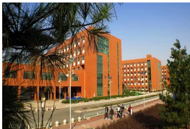
Hebei Institute of Communications

Fundado em 2000, o Instituto de Comunicações de Hebei se destaca nas formações em mídia e arte, cobrindo uma ampla gama de disciplinas, como design, comunicação, gestão, humanidade e ciência. A instituição, que desenvolve parcerias com outras 50 universidades estrangeiras, fica em Shijiazhuang, capital da província de Hebei. Funciona em três campi, distribuídos em 13 unidades de ensino. A Universidade possui mais de 18 mil alunos de graduação e outros 500 pós-graduandos.