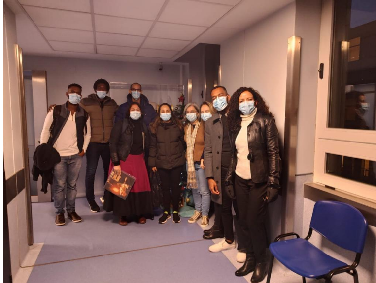
Missão Pesquisa Portugal